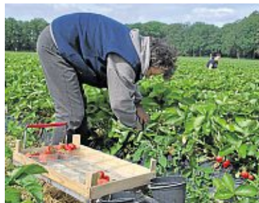
Knochenarbeit für die Pflückerinnen: Das Bücken geht ganz schön in den Rücken.

Trotz des Pechs bleibt Bäcker hoffnungsvoll: „Diese Saison läuft schlecht, aber wir stehen ja erst am Anfang.“ Er ist gespannt, wie sich seine neue Sorte „Asia“ am Markt durchsetzen wird. Geschmacklich findet er sie einwandfrei, aber hübsch ist die Frucht nicht. An der Spitze gekerbt und zu groß und fleischig, das könnte Käufer zunächst abschrecken. Eine optisch ideale Erdbeere ist mittelgroß, fest und vor allem ohne gequetschte