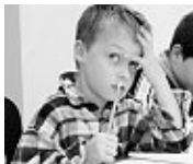
Kinder nicht vorschnell abgestempeln – Förderung hilft.

Manchen Kindern fällt es scheinbar schwer, sich zu konzentrieren. Sie vermeiden das Lesen und verstehen das, was sie lesen, einfach nicht. Ihre Schrift ist nicht zu entziffern und ihre Rechtschreibung eine einzige Katastrophe. „Diese Kinder werden mitunter schnell abgestempelt, doch sind sie weder